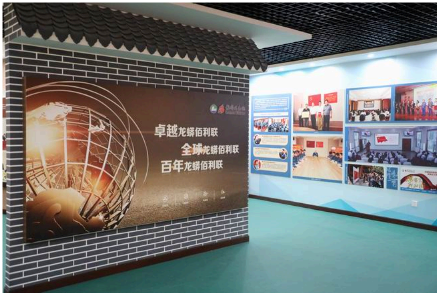
龙佰集团党建文化阵地党建展厅

一直以来，争创优秀党员、争创岗位能手、争创党员示范岗等评比活动，在龙麟佰利联有序展开，以点带面，为企业发展添正气，聚合力。近三年来，龙麟佰利联党委以氯化钛白分公司党支部为标杆，在公司范围内广泛开展“一名党员 一面旗帜”党员示范岗创建工作。目前，龙麟佰利联党委共评出焦作基地钛一间歇岗位、水处理车间新系统中和岗位、新材料富钛料分公司冶炼车间二号炉前岗、氯化钛白分公司CP主控、武定公司熔炼车间、液氯二甲醚车间等党员示范岗50余个，现了“竖起一面旗、带动一大片”的党员模范带动作用。