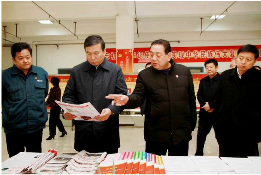
焦作市委书记王小平调研公司党建文化建设情况