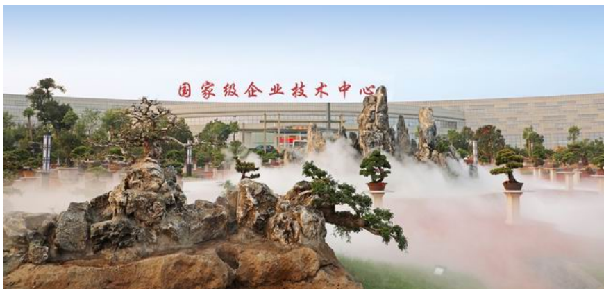
景观独特的国家企业技术中心

龙麟佰利联党委创新党建工作，致力于把生产经营能手培养为党员，把党员培养为骨干。通过开展党员之星评选和优秀党员评选活动，龙麟佰利联党委引导党员在学习上刻苦钻研、在技术上争当能手、在安全上遵章守纪、在生产上勇挑重担、在工作上精益求精，并形成带动示范效应。在短短100余天里，龙麟佰利联实现了新立钛业复产的阶段性胜利，进一步鼓舞了全员士气，为新立钛业建设成为“集团新的经济增长点、全球最大的海绵钛生产基地”奠定了基础。