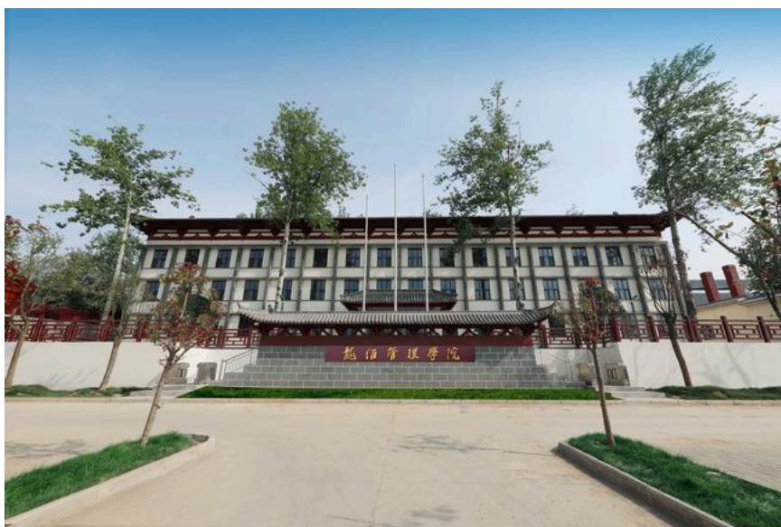
温馨怡人的龙佰管理学院

绿水青山就是金山银山。龙鳞佰利联党委以“建设绿化精品工程，全力打造生态园林式龙佰工业园区”为宗旨，加大生态环境治理，先后累计投资360万余，对“钟秀花园”“毓秀花园”“科技花园”等厂区花园进行了升级改造，使企业逐步走上了绿色发展之路。员工们自豪地说：“我们的企业像花园，工作更舒心了，头也更足了。”