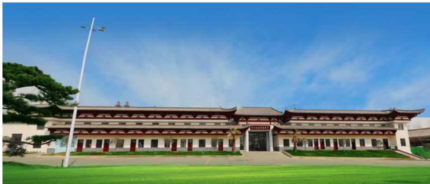
智能化员工生态智慧餐厅

为增强员工的获得感、幸福感、安全感，龙鳞佰利联党委持续开展“关爱员工”工程，对员工思想上引导、工作上爱护、生活上关爱，让员工深感受到的温暖而激发工作干劲，提升了员工对企业的归属感。2016年，龙鳞佰利联投资2500余万元建设了美丽的馨苑公寓，员工享受到了更舒适的生活环境；2018年投资4000余万元建设了生态智慧餐厅、龙佰管理学院、现代化大型停车场等。